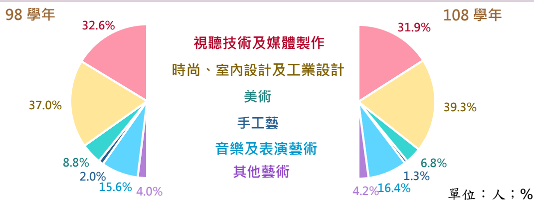
大專校院就讀藝術學門相關學類學生數

進一步觀察 108 學年藝術學門各學類學生數，以「時尚、室內設計及工業設計」4.0 萬人或占 39.3% 居首，「視聽技術及媒體製作」3.3 萬人或占 31.9% 居次，合計占逾 7 成 1；另因耗費較多人力及時間之手工藝產品逐漸被機械化量產產品取代，致 10 年間「手工藝」學類人數減少 17.3%，其餘學類就讀學生數皆呈增加，並以「音樂及表演藝術」、「時尚、室內設計及工業設計」及「其他藝術」均增逾 4 成較為顯著。