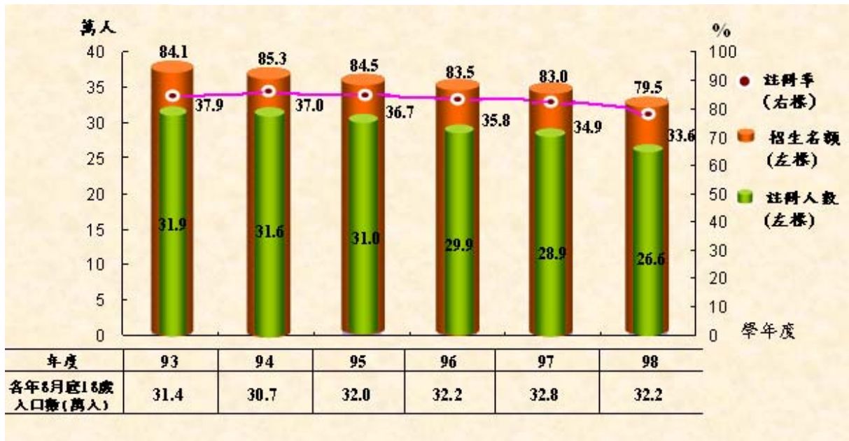
表1. 大專校院新生註冊人數增減比較